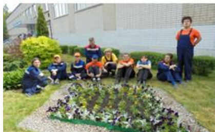
МБОУ СОШ №10