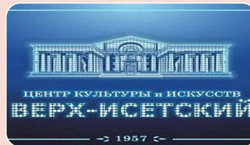
ЦЕНТР КУЛЬТУРЫ и ИСКУССТВ ВЕРХ-ИСЕТСКИЙ