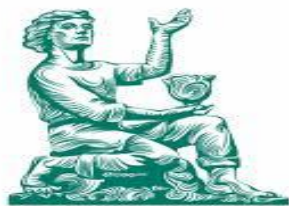
Уральский клинический лечебно-реабилитационный центр