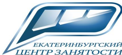
ЕКАТЕРИНБУРГСКИЙ ЦЕНТР ЗАНЯТОСТИ